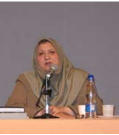
کارگاه آموزشی ازدواج دانشجویی