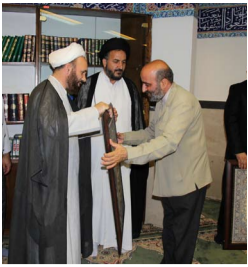
گرامیداشت هفته دفاع مقدس