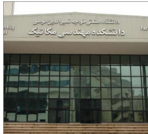
دانشکده مهندسی مکانیک در بین برترین های مهندسی مکانیک جهان