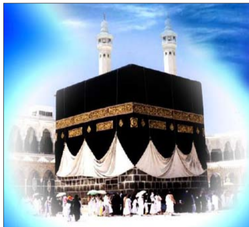
ایجاد قربان و غدیر مبارک باد روابط عمومی دانشگاه